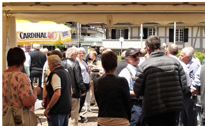
Der von der Gemeinde gespendete Apéro mit Wein aus dem Wyhus Belp schmeckte dann trotz Verzögerung allen vorzüglich.