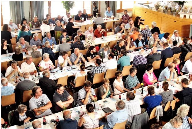
Es gab viel Interessantes zu hören.