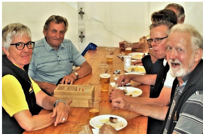
Harziger Start des Losverkaufs. Am Sonntag waren aber alle weg.