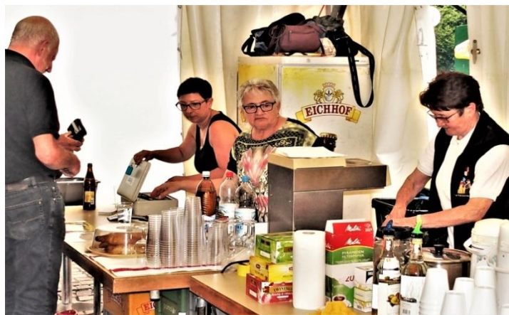
Zuerst müssen jedoch entsprechende Bons gelöst werden.