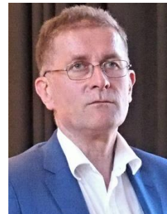
Regierungsrat Christoph Neuhaus