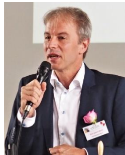
Gemeindepräsident Benjamin Marti