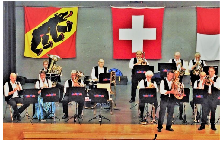
Abendunterhaltung mit der „Bouelemusig“ aus dem Emmental. Effektiv abwechslungsreiche Musik vom Feinsten. – Applaus!