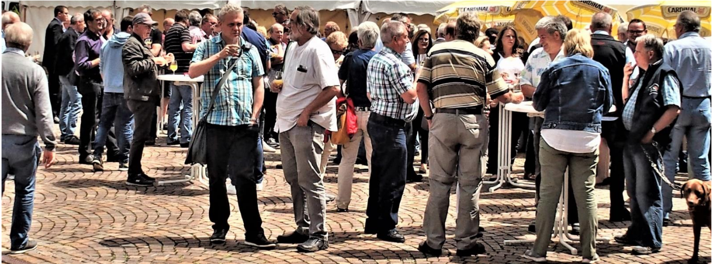
Der Apéro bot die gute Gelegenheit, die 144. DV Revue passieren zu lassen und mit Freunden anzustossen.