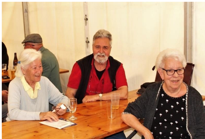
Gemütlicher Höck in der gut laufenden Festwirtschaft.