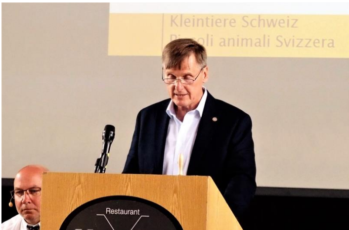
Der Gewählte erklärte die Annahme der Wahl und freute sich über die grossen Beifalls-Bezeugungen.