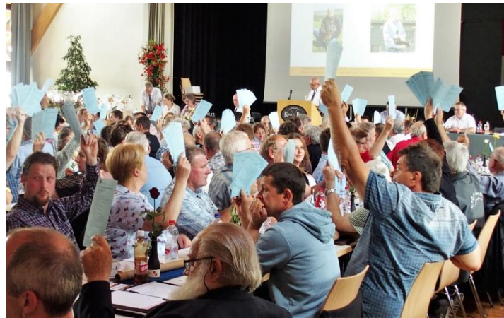
Und dann wurde gewählt: