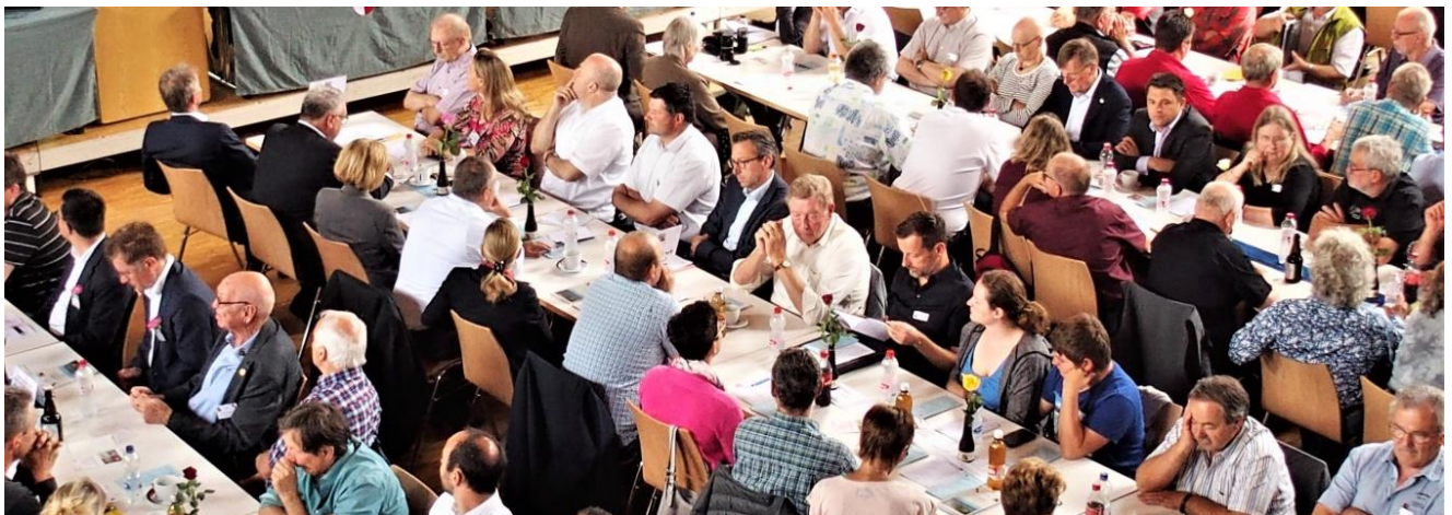
Obwohl's auch Schläfrige gab: Die meisten Delegierten folgten der Versammlung mit grosser Aufmerksamkeit.