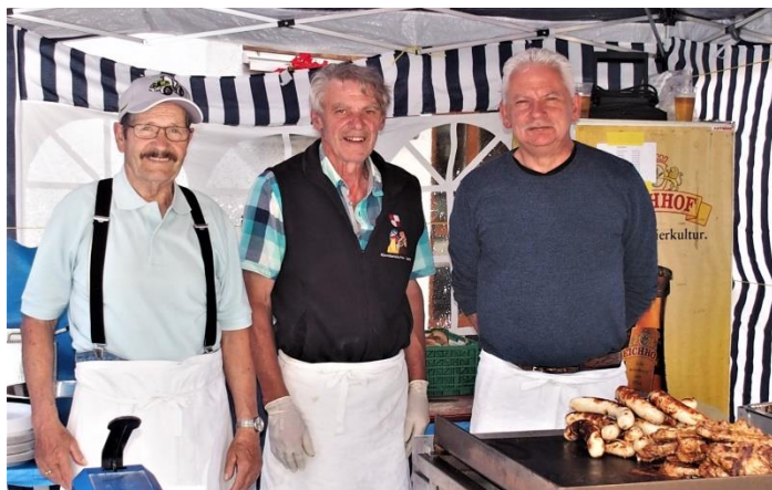
Die Küchenmannschaft ist parat.